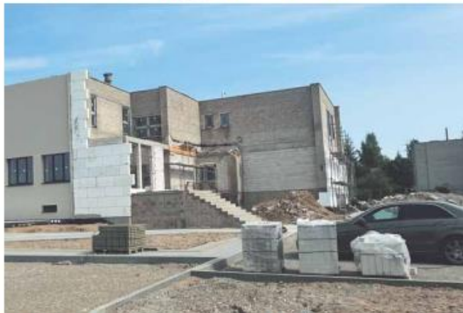
VšĮ Pagėgių pirminės sveikatos priežiūros centrui (PSPC) priklausančiose patalpose darbai pradėti dar 2022 metų balandžio 14 dieną.